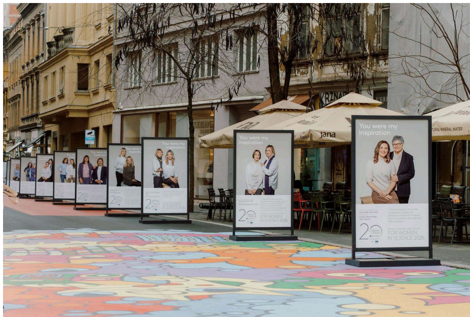
'Bila si moja inspiracija' obilježila je 20 godina L'Oréal-UNESCO programa 'Za žene u znanosti'